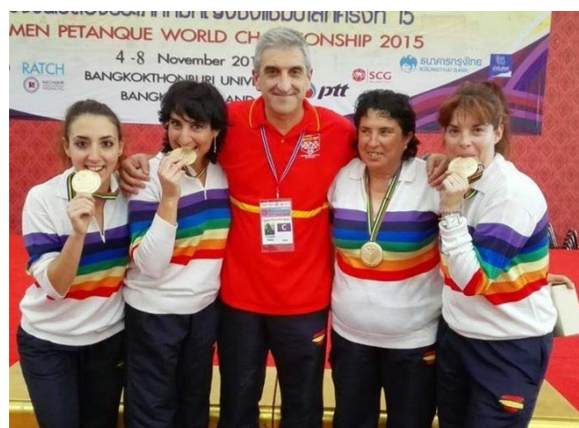
Championnes du Monde 2015: Spain /Espagne