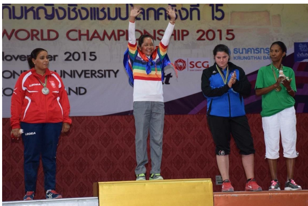
Championne du Monde en Tir de precision: Leng KE (Cambodia)